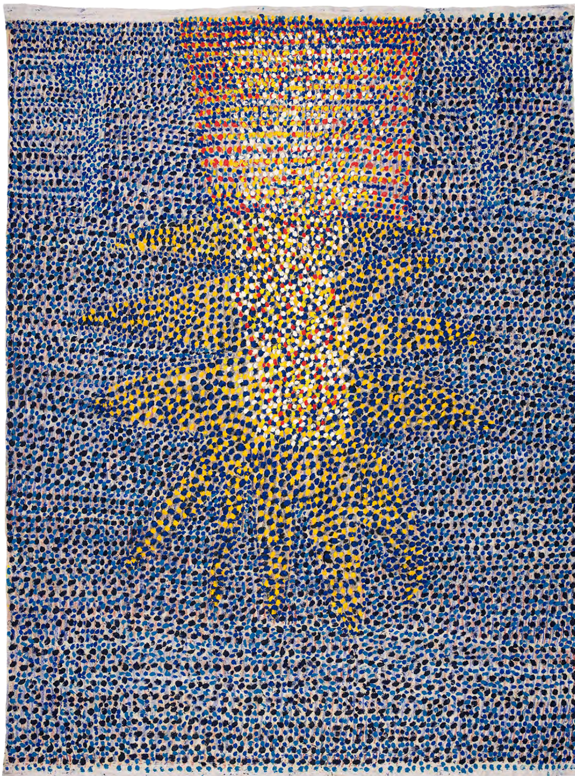
Drap 7 - Les 12 disciples et Jésus

ÉGLISE SAINT-FRANÇOIS DU 16 AVRIL AU 21 JUIN